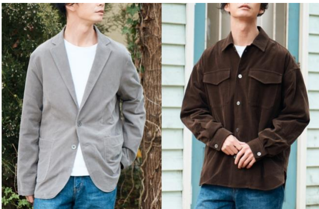
▲ライトジャケット (グレー) ▲シャツブルゾン (ブラウン)

当商品の開発にあたり、今までにない生地を作りたいという思いから、素材や加工技術をさまざまに組み合わせながら試作を重ね、模索を繰り返しました。そして、コーデュロイ特有のごわつき感がない、柔らかな手触りの特別なコーデュロイが完成！